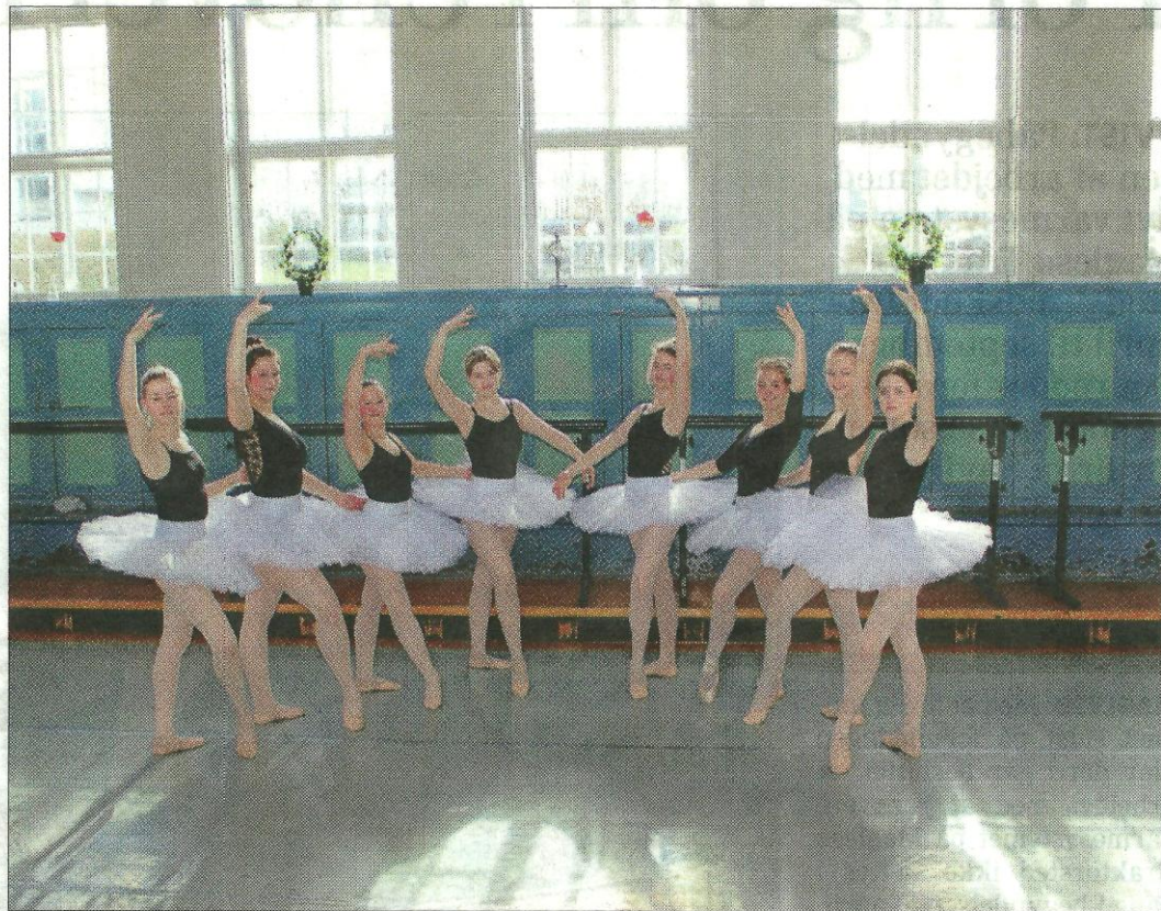
Holbæk Ballet Akademi har både noget til de små og de store piger. Og drenge er faktisk også meget velkomne. Privatfotos