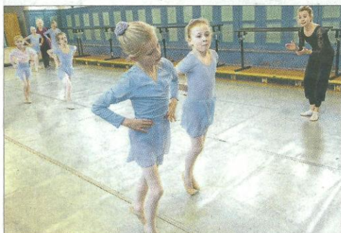
På hold 2 er dresscoden lyseblåt, og her er balletpigerne i gang til H.C. Lumbyses taktfaste musik i »Trompetpolka«.